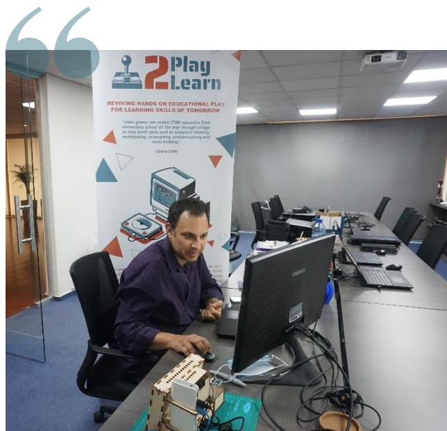
This project has been funded with support from the European Commission. This communication reflects the views only of the author, and the Commission cannot be held responsible for any use which may be made of the information contained therein.

Todo o feedback recebido até agora, tem sido muito positivo, estamos ansiosos/as pela próxima e última fase do projecto!